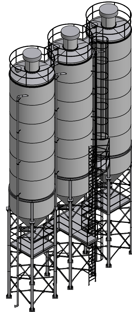
A-A ( 1:50 )